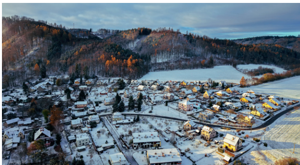
Zasněžená západní část Potštejna, 23. 11. 2024

V rámci oprav komunikací byla opravena nebo zakonzervována řada částí komunikací v obci. Provedeno to bylo postříkem asfaltovou směsí. Asfaltový povrch byl položen v ulici Školní a na křižovatce a komunikaci v Brné. Připraveny máme projekty na opravy pěti dalších komunikací. Pro finanční náročnost však žádáme o dotace, a tak realizace oprav záleží na jejich získání. Uspěli jsme v získání dotace na chodník Potštejn – Záměl, jeho realizací výrazně přispějeme k bezpečnosti chodců a obyvatel obou obcí.