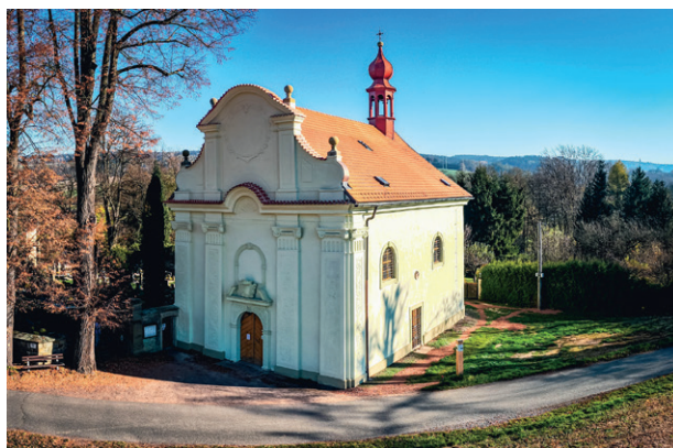
Nově opravená další část pláště kostela sv. Marka

Dokončeny byly i práce další etapy oprav kostela sv. Marka. V této etapě byla opravena fasáda a okna. Řešeno bylo i nové napojení na elektrickou síť.