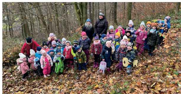
Zamykání lesa, 27. 11. 2024

tématikou – hledání broučků v krupici, tvoření sovy z listů, skládání obrázků a prolézání pavučinou, kterou hlídala velký pavouk, a mnoho dalších. Celá akce poté byla zakončena stezkou odvahy, kdy děti ve dvojici šly s lampionem po vyznačené trase za rodiči. Děkujeme rodičům za účast.