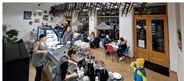
Nově otevřené RE: Bistro