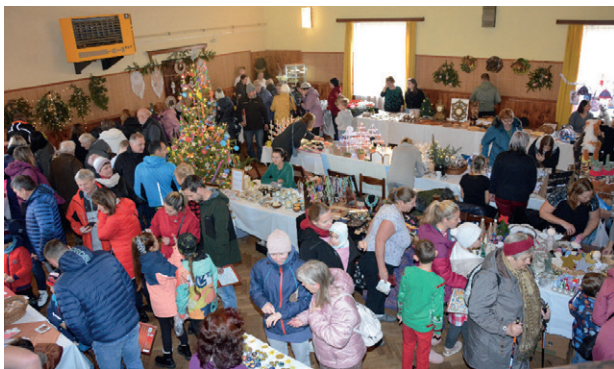
Adventní výstava v Hotelu Slavie

Bohužel pro nepřízeň počasí byly oslav y přeloženy na náhradní termín. Ani tomuto termínu počasí mnoho nepřálo. Oslavy proběhly přesto důstojně. Náš spolek měl spolu s ostatními spolky malou výstavku na panelu propůjčeném obcí, kde jsme na jedné straně měli vzpomínku na historii spolku a na druhé jsme se věnovali současné činnosti. Výstavka byla doplněna výpěstky členů a dekoracemi z květin, trav a zeleně. Na konci října jsme zazimovali záhony, růže, uklidili truhlíky, mísy. Tím jsme ukončili pro tento rok naší hospodářskou činnost a splnili závazek obci o starost se zkrášlováním středu naší obce.