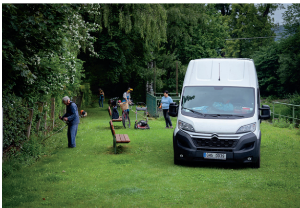
Brigáda u splavu, 4. 6. 2024

na hřbitovní odpad. V průběhu podzimu jsme zazimovali mobilní lavičky z plážičky Pod Lipami a z prostranství u Spáleného mostu a do plastových pytlů uložili lavičky na Letné. Při okrašlování Potštejna a jeho okolí naši členové a příznivci okrašlovacího spolku odpracovali na 174 hodin. Děkujeme všem, kteří přiložili ruku k dílu.