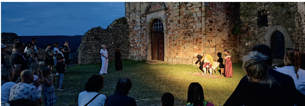
Z nočních prohlídek hradu Potštejn

v Potštejně. A nakonec jsme se v sobotu 30. 11. 2024 opět zapojili do rozsvěcení vánočního stromu v Potštejně. Konkrétně jsme odehráli dvě scénky: Bílé Vánoce (v originále romantická píseň White Christmas, v našem podání lehká parodie na Vánoce) a Živý betlém (spojený s koledou Dej Bůh štěstí tomu domu).