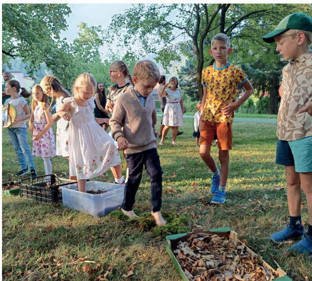
První školní den - bosochodecká stezka, 2. 9. 2024