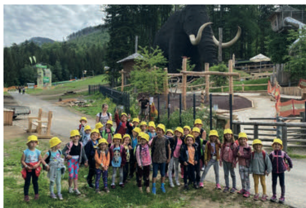
Výlet na Dolní Moravu 8. 6. 2022

Na konci školního roku děti prožily nemálo zážitků . Oslavili jsme Den dětí zábavným programem „Bublínkohraní“, kde si děti mohly vyrobit spoustu různých druhů a velikostí bublin. Nejvíce je však bavilo, když bubliny praskaly. Také jsme si společně zašli na zmrzlinu do místní cukrárny. Školkový výlet jsme strávili v zábavních parcích na Dolní Moravě, který si děti opravdu užily. Nejdříve na ně čekaly lesní víly, se kterými děti plnily několik úkolů s tématem ochrany přírody a potom už se mohly naplno vydávat ve vodním, lesním i pískovém parku. Závěrečnou akcí roku byla zahradní slavnost, kde jsme se rozloučili s dětmi, které v září nastoupily do první třídy.