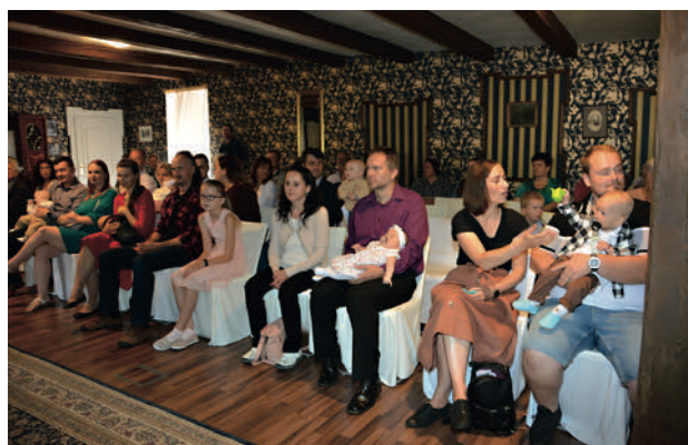
Potštejnský zámek byl opět plný dětí, rodičů a milých hostů