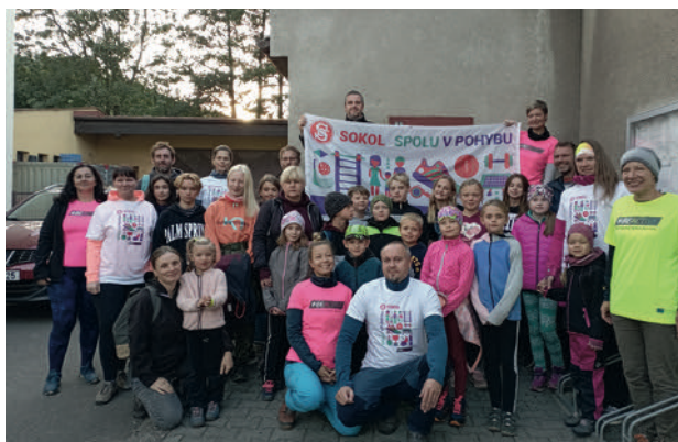
Noční výšlap po okolí Potštejna 24. 9. 2022

V září zahájila naše tělocvičná jednota nový cvičební rok. Opět zajišťujeme pravidelná cvičení pro všechny naše členy, ale pořádáme i jiné akce. V týdnu 23. září – 30. září jsme se zapojili do již tradiční akce, kdy jsme se snažili představit i veřejnosti naše aktivity. Letos bylo tématem používání tělocvičného náradí a náčiní . První velkou akcí byl v rámci aktivity Be active Noční výšlap do okolí Potštejna, který se uskutečnil v sobotu 24. září. V 18:00 jsme se sešli před sokolovnou a vyrazili vpřed. Trasa vedla přes Liščí doly, lesními i polními cestičkami a přes Záměl zpět. Po cestě se sice někteří snažili sbírat houby, ale za chvíli nebylo moc vidět a museli jsme použít čelovky a jiné svítilny. Po 9 km se všech 37 účastníků vrátilo zpět k Sokolovně, kde byly rozdány věcné i sladké odměny.