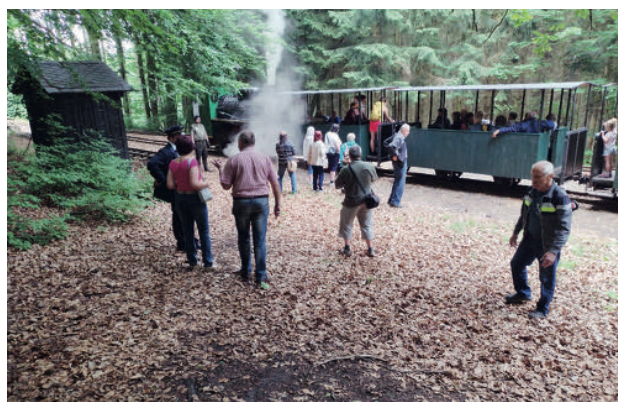
Zastávka vláčku v Mladějově

Měli jsme naplánovaný výlet na den 3. 6. 2022. Výletu přálo počasí které bylo rozhodující pro poslední cíl výletu. Navštívili jsme muzeum starých strojů v Žamberku a po obědě jsme jeli do Mladějova svézt se parním úzkorozchodným vláčkem. Měli jsme v plánu ještě návštěvu kaktusů pana Kokory, ale tam jsme se omluvili, neboť bychom byli v časovém skluzu. Zdržela nás restaurace, kde jsme byli na obědě. Kaktusy zhlédneme někdy příště.