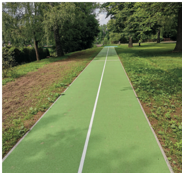
Nová běžecká dráha s doskočištěm v parčíku poblíž ZŠ

Mimo ZŠ a MŠ mají na nových sportovištích vyhrazeny pevné časy pro svoji přípravu složky T. J. Sokol, T. J., z.s. a hasičský kroužek mládeže. V ostatním čase je možnost využití multifunkčního hřiště i ostatními občany naší obce.