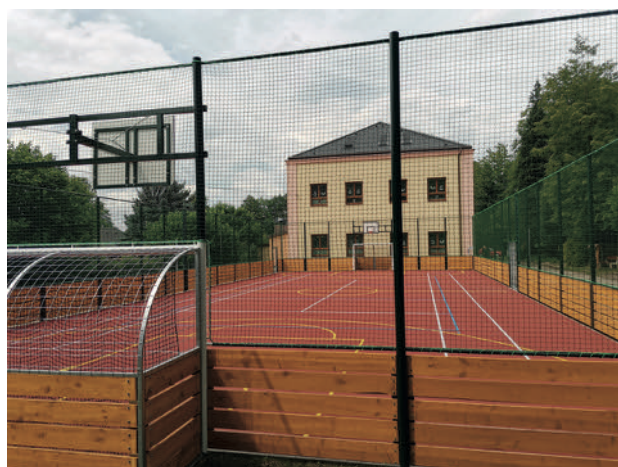
Nové multifunkční hřiště mezi budovami ZŠ a MŠ

Správcovskou činnost vykonává T. J. Sokol Potštejn. V případě zájmu si zarezervujte sportoviště na tel. č. 734 303 975. Běžecká dráha je k dispozici kdykoli bez rezervace. Na multifunkčním hřišti je možné hrát malou kopanou, tenis, volejbal, basketbal a další míčové hry. Síť jsou k dispozici přímo u sportoviště – informace při zapůjčení klíčů.