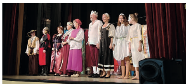
Pohádka v Nechanicích

I ve druhé polovině tohoto roku se nám podařilo odehrát mnoho představení pohádky Jak se chudý král do boje chystal. Namátkou jmenuji: 12. června v rámci divadelního festivalu na hradě Skuhrov, na Vampark festu ve Vamberku 25. června, 3. září v Bolehošti a opět - po delší „covidové“ odmlce – jsme se podívali do Nechanic, kde jsme zahráli 23. října v rámci Přehlídky divadelních spolků. Zjevně poslední bylo letos představení, které jsme hráli 7. prosince na besídce společnosti Isover v Častolovicích.