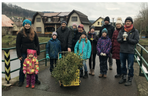
Roznášení Betlémského světla v Potštejně 23. 12. 2019

I v Potštejně má Betlémské světlo dlouhou tradici. Od poloviny devadesátých let vždy na Štědrý den roznášeli