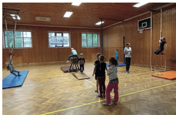
Sokol v pohybu - atletický víceboj 27. 9. 2022

A co nás ještě čeká do konce kalendářního roku? Plánujeme vánoční cvičení v jednotlivých cvičebních hodinách, pravidelné bruslení v Ústí nad Orlicí, přespávačku pro starší žákyně a také zimní radovánky pro nejmenší.