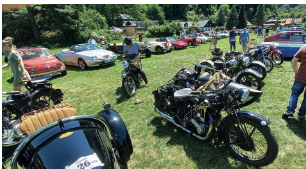
Výstava historických vozidel na Bělisku

Sedmý ročník „ Orientačního závodu historických vozidel “ se uskutečnil v sobotu 18. 6. 2022 a patřil v jeho historii k těm nejpovedenějším. Počasí nám dopřalo překrásný jarní den, a tak se na Bělisko sjelo na 80 historických automobilů a motocyklů. Bylo na co koukat! K závodu jako takovému se přihlásilo 46 účastníků, kteří v brzkých odpoledních hodinách vyrazili na 100 km dlouhou orientační trať, vedoucí je přes Orlickoústecko, a Jablonné n. Orl., až do Orlických hor – a pak zpět do Potštejna. Cestou bylo jejich úkolem vyhledávat stanovené orientační body a na nich hledat požadované informace. Komu se dařilo nejlépe, dostal nejvíce bodů – a v podvečer se na Bělisku postavil na stupně vítězů. Akce to byla krásná, vonící