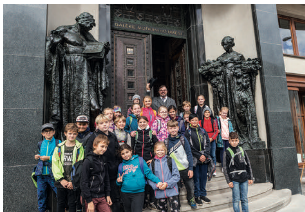
Projektový den s J. Gočárem v Hradci Králové 19. 10. 2022