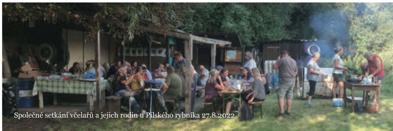
Společné setkání včelařů a jejich rodin u Pilského rybníka 27.8.2022