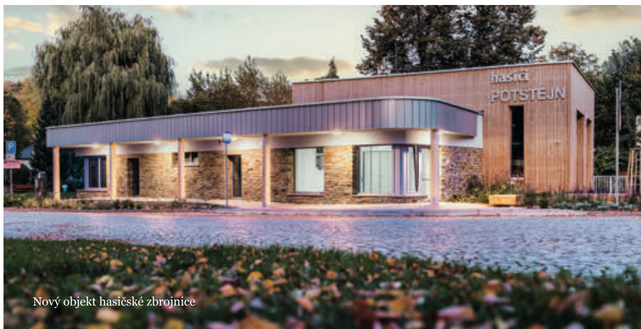
Nový objekt hasičské zbrojnice