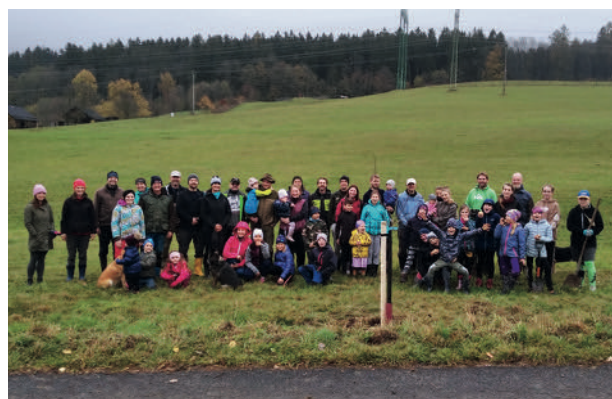
Sázení stromů na Brně 5. 11. 2022