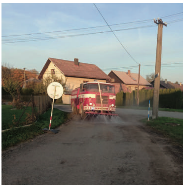
Kropení ulice Pod Nádražím kvůli uzavírce silnice

V měsíci září proběhlo školení výjezdové skupiny v Rychnově nad Kněžnou, kde jsme se zdokonalovali v manipulaci s vyprošťovací technikou, hašení pěnou a dýchací technice v přístrojích. Další školení strojníků proběhlo taktéž v měsíci září v Borohrádku. Během uzavírky silnice jsme kropili cestu v ulici Pod Nádražím, abychom alespoň trochu pomohli občanům, kteří museli čelit komplikacím s dopravní situací.