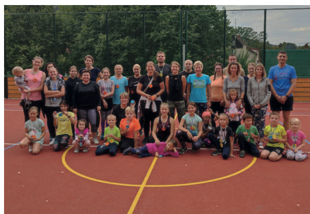
Sportovní odpoledne s rodiči 13.9. 2022

Také jsme uskutečnili dvě pěkné akce pro rodiče i děti naší školy: sportovní odpoledne, kde si rodiče s dětmi vyzkoušeli některé disciplíny, které žáci plní do Odznaku všestrannosti. Druhou akcí bylo odpoledne, kdy měli rodiče možnost poznat moderní technologie, aplikace a programy, se kterými děti při výuce pracují. Tyto aktivity jsme již několikrát ukázali i kolegyním a kolegům z jiných škol, neboť naše škola má velmi kvalitní IT vybavení.