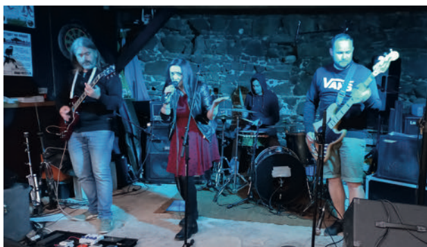
Kytary na hradě 2022 - kapela Stepující Samožrout

Ač bylo v plánu uskutečnit na hradě festivaly dva, muzika se zpoza jeho hradeb ozývala jen jednou – na jaře. Festival „ Kytary na hradě XIII. “ zde proběhl v sobotu 28.5. a zahrály na něm čtyři rockové a metalové kapely. Akce se nesla v komornějším duchu – přesto ale neztratila nic ze svého kouzla, které jí středověký hrad propůjčuje.